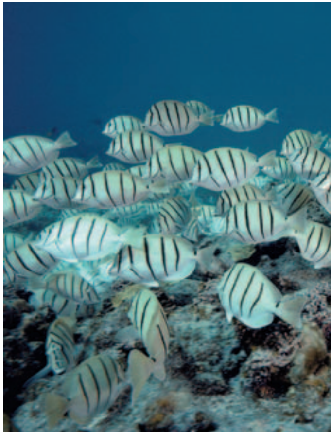
Falterfische: Grunzen in der Not.

• Kenneth C. Davis, «Wo hat Prometheus das Feuer versteckt», Ehrenwirth, 700 Seiten, 35 Franken.