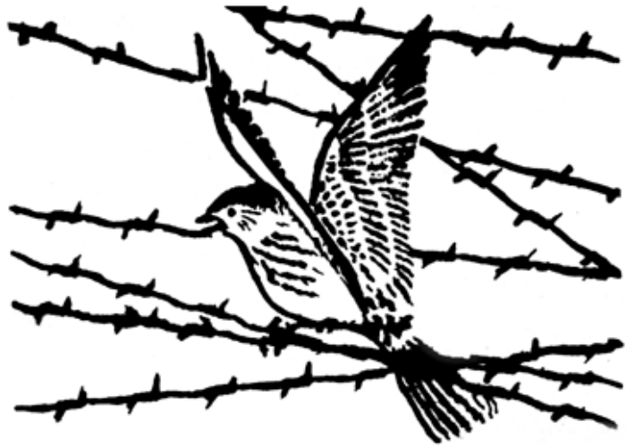
Bulldozer "Cuando Salga Yo"

Si Ud. y la madre de su niña no están casados y no están de acuerdo o no pueden utilizar la Declaración de Paternidad, entonces Ud. tendrá que presentar una demanda en la corte para establecer que Ud. es el padre. Ud. puede solicitar custodia, visita y/o mantenimiento del niño como parte de la demanda. Ud. tendrá que presentar una forma "Complaint to Establish Parental Relationship" (Demanda para Establecer una Relación de Padre) mas varias otras formas (dependiendo de si está solicitando la visita o la custodia o solamente estableciendo la paternidad). Debe pagar el costo (puede ser diferido) para presentarlo en la corte, pedir una fecha para la audiencia, arreglar que le sirvan los documentos a la madre, y tiene que arreglarlo para llegar a la corte.