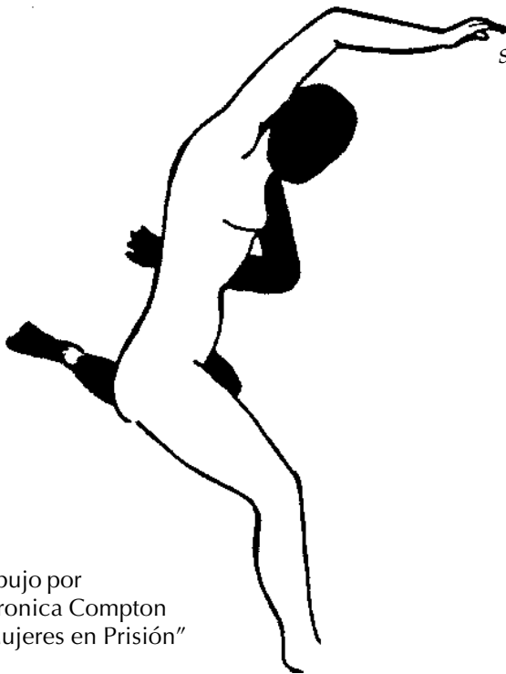
Dibujo por Veronica Compton "Mujeres en Prisión"

Los nombres de Lydia y Genoveva son ficticios pero su historia es verdadera.