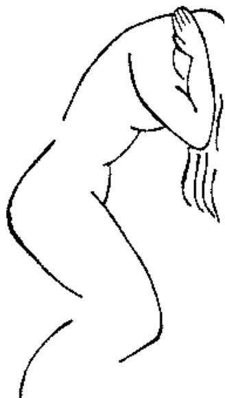
Veronica Compton “Mujeres en la Cárcel”