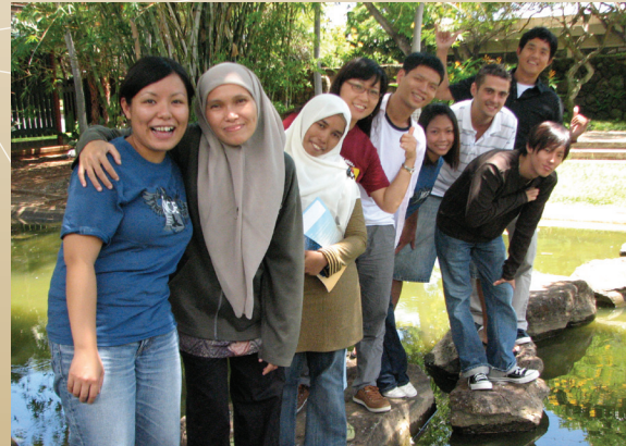
NICE Program, Outreach College, UH Mānoa