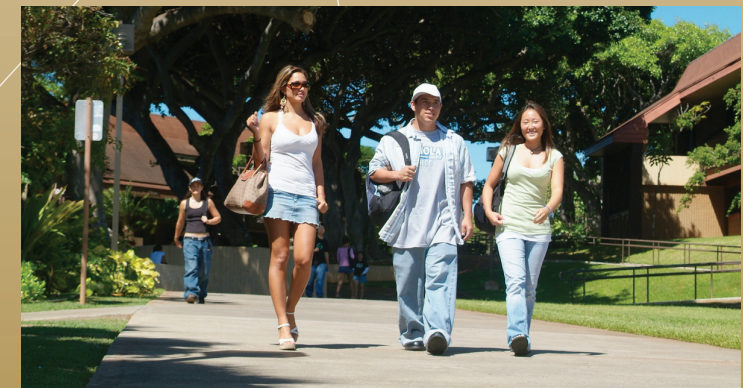
UH Kapi'olani Community College