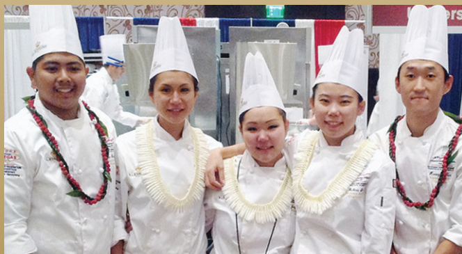
UH Kapi'olani Community College