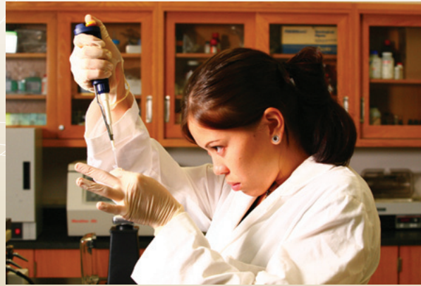
UH Windward Community College